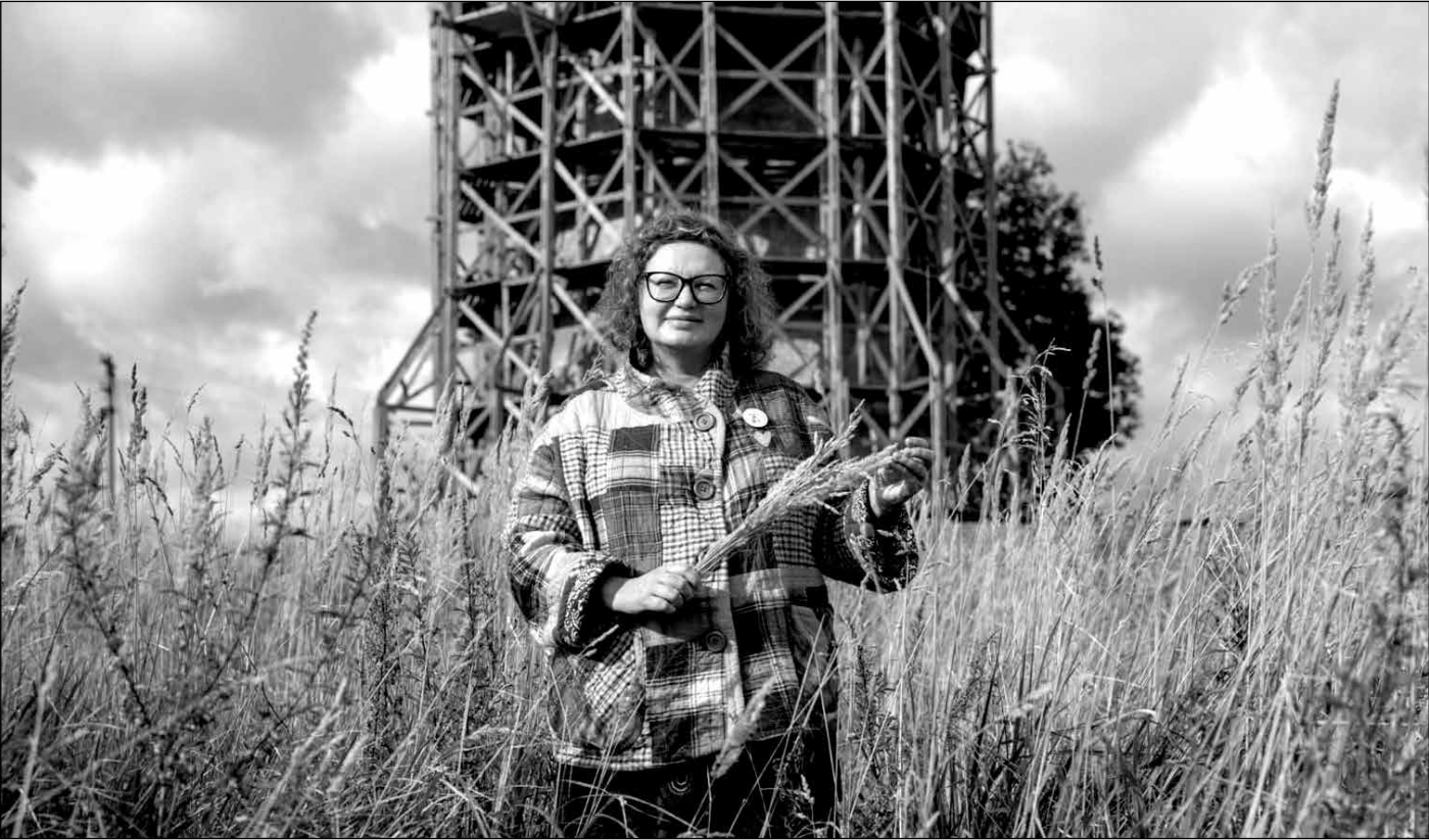
Одной из героинь документального фильма режиссёра Ольги Лаптевой стала столетняя мельница в деревне Завал.