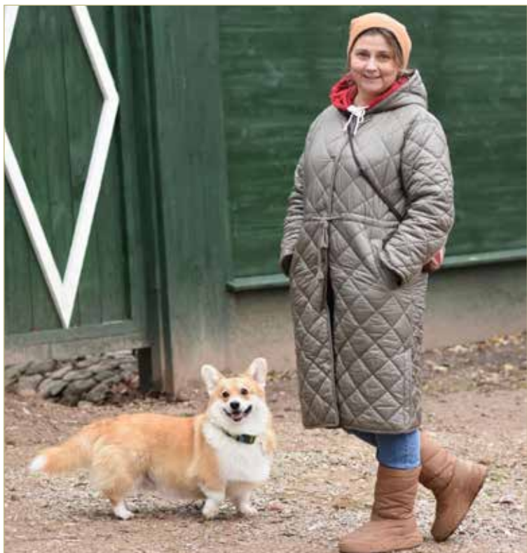
А вообще, мы с Ватсоном хотим, чтобы везде было дог-френдли, то есть чтобы люди были готовы принимать собак и их владельцев.