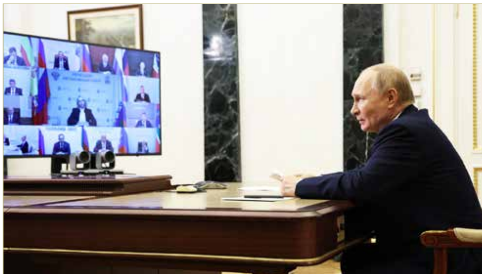
Президент провёл встречу с избранными губернаторами 21 региона в режиме видеоконференции.

— Очевидно, россияне рассчитывают на продолжение стратегического курса развития страны. На то, что он принесет дальнейшие перемены к лучшему в их регионах, родных городах, посёлках. Конечно, очень важно оправдать это доверие, выстраивать в каждодневном режиме свою работу так, чтобы она соответствовала заявленным планам, — сказал Владимир Путин.