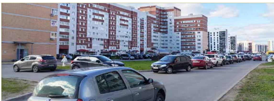
Налоги на недвижимость, а также транспортный, земельный и другие нужно оплатить до 1 декабря.

Важный нюанс — самому считать ничего не нужно. На-