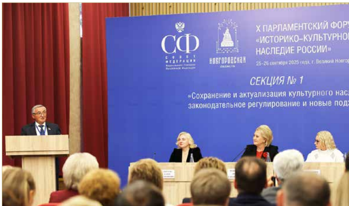
Предложения новгородских депутатов ждут одобрения Государственной Думы.

Одна из инициатив — упростить процедуру исключения объектов культурного наследия регионального и местного значения из реестра, если они полностью утрачены или потеряли историко-культурную ценность.