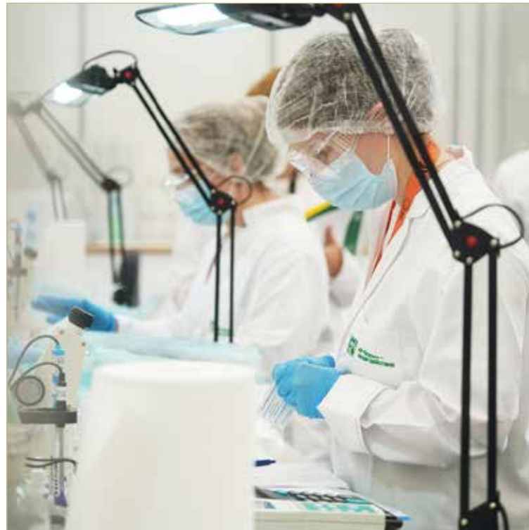
Финалисты Чемпионата изготавливали жидкие и твёрдые лекарственные формы в специальных стерильных боксах.

— Поскольку всему сразу в колледже не учат, для многих финалистов современное обо-