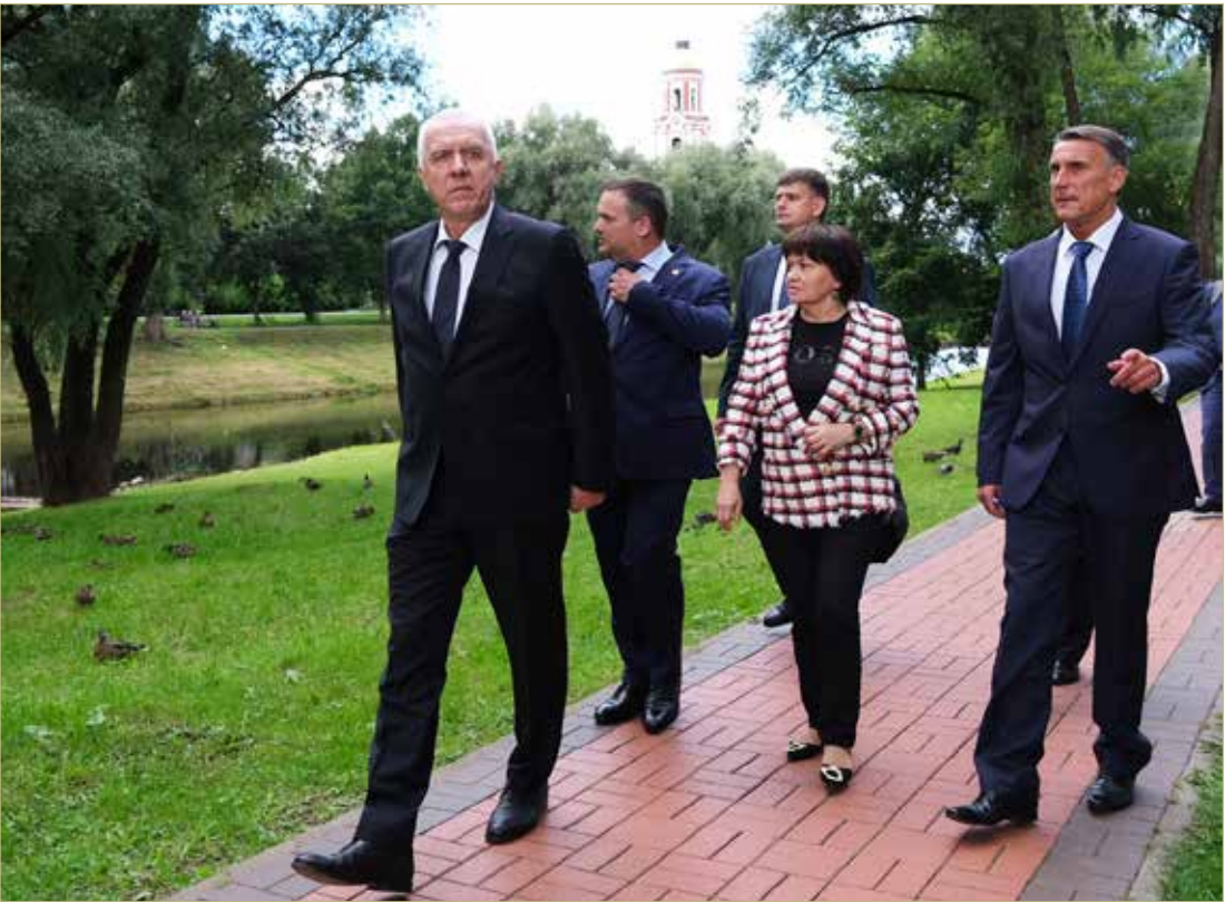
Увеличение турпотока на Новгородчину Александр Гуцан и правительство региона обсуждали в Старой Руссе в 2022 году.

Министр строительства и жилищно-коммунального хозяйства России Ирек ФАЙЗУЛЛИН подчеркнул, что площадка форума стала инструментом открытого диалога и принятия решений в сфере сохранения ОКН. Глава ведомства акцентировал внимание на совершенствовании нормативного регулирования в этой сфере. Министр также считает необходимым перейти от государственной историко-культурной экспертизы к оценке сохранности исторической и культурной ценности объекта с получением разрешения на проведение работ. По его мнению, этот шаг позволит усилить защиту памятников. Кроме того, Ирек Файзуллин отметил, что важным инструментом развития малых городов и исторических поселений стал Всероссийский конкурс лучших проектов создания комфортной городской среды.