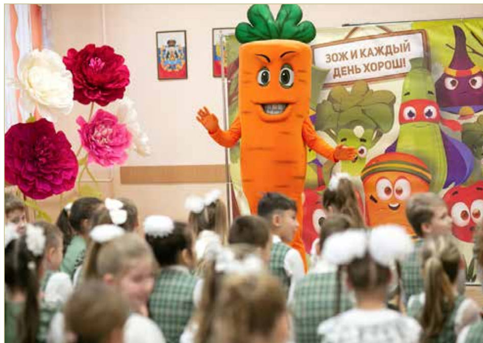
Проекты «Школы здоровья и красоты» интересно расскажут о правильном питании.

— Будут, но не на витринах, не в привычном понимании. Самым большим экспонатом станет двухметровое надувное сердце. Будет макет сердца размером поменьше. Дети смогут его разобрать, чтобы понять его строение, как оно работает. Подобный формат ненавязчивого донесения информации, когда экспонаты разрешается трогать, больше всего подходит ребёнку. Она запомнится. Демонстрируя макеты органов, используя специальные реквизиты, устраивая для детей квесты, мы помогаем им узнать и понять, почему важно сохранять здоровье, как пагубные привычки негативно на него влияют, а также как правильно питаться и почему нужно уделять время спорту.