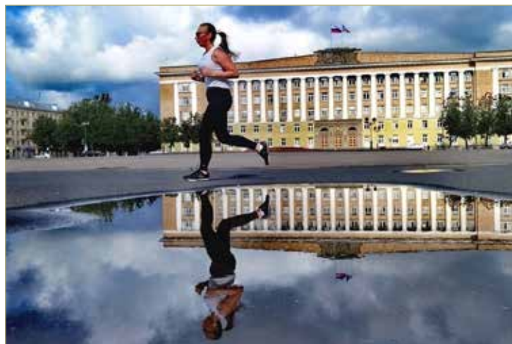
Физически подготовленные люди для увеличения кардионагрузки могут заниматься бегом.

Неделю с 29 сентября по 5 октября министерство здравоохранения Новгородской области посвящает важности ответственного отношения к сердцу в честь Всемирного дня сердца, который отмечается 29 сентября.