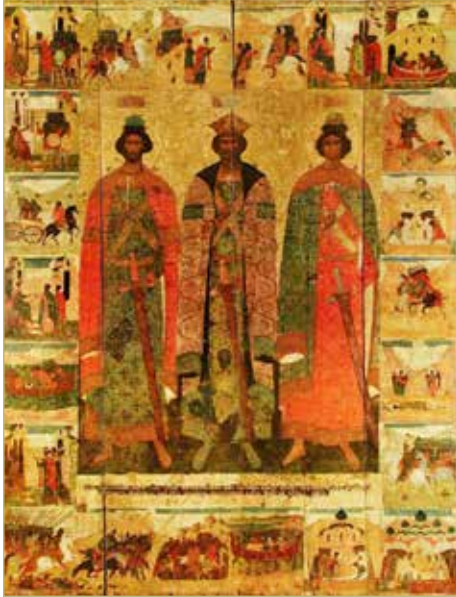
В рамках межмузейного обмена в Новгороде экспонируется икона «Святые равноапостольный князь Владимир и благоверные князья-страстотерпцы Борис и Глеб в житии», а в Пскове — «Деисус с предстоящими свв. Варварой и Параскевой».

Уже через месяц после прибытия памятников искусства, в январе 1948 года, более 300 икон были отправлены Пскову. Затем происходил отбор наиболее ценных произведений для реставрации в столичных мастерских — ГЦХРМ.